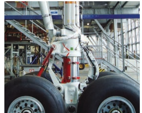
Sacklochbohrung im Landebein